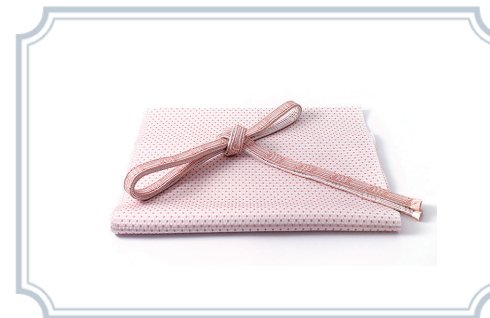
帯揚げ / 帯締め